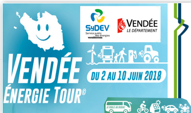
A noter dans les agendas le Vendée énergie Tour du 2 au 10 juin 2018

Posté le 20/12/2017 à 08:00 par Philippe Schwoerer - Lu 1304 fois - Poster un commentaire