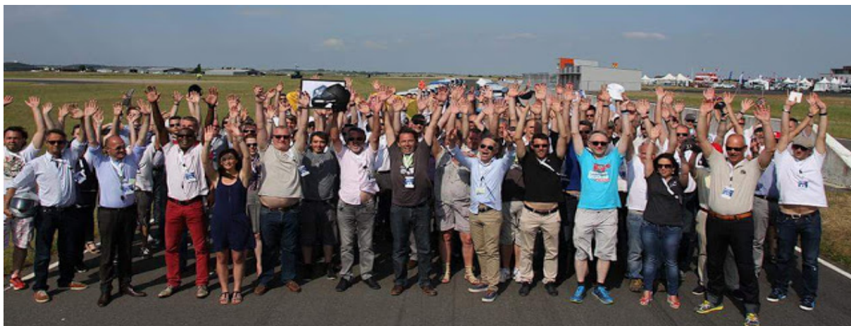
Vendée Electrique Tour 2015 un succès pour la centaine de VE participants