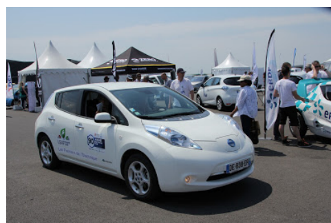
La Leaf aux couleurs du Leaf France Café

Nous devons anticiper la suite, car la borne rapide suivante était encore loin... et nous y sommes d'ailleurs arrivés à sec ! (indiqué 5% quand nous avons mis la charge en route). On repart chargé à