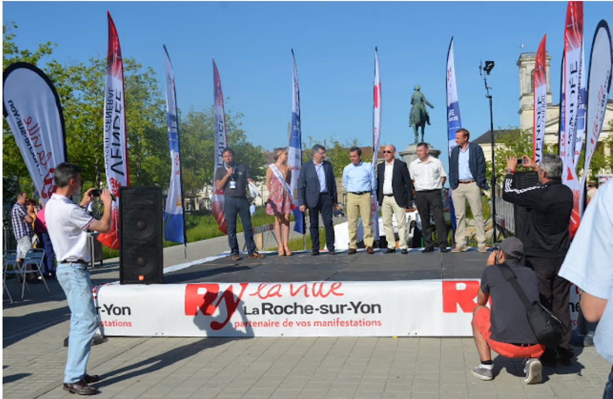
Le podium d'arrivée